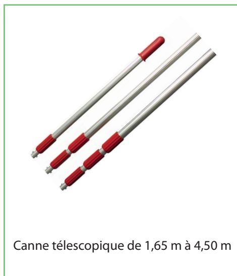
Canne télescopique de 1,65 m à 4,50 m